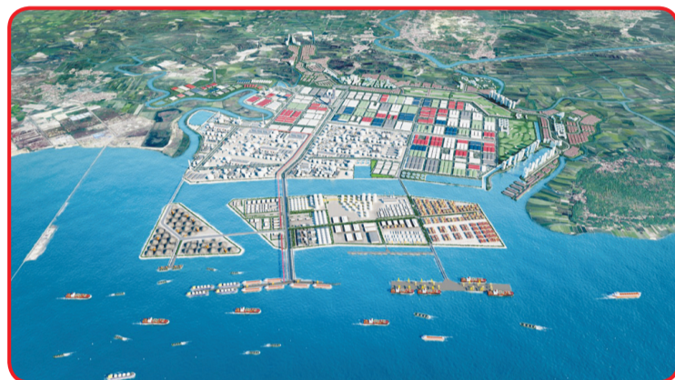
Kawasan Ekonomi Khusus Gresik JIPE.