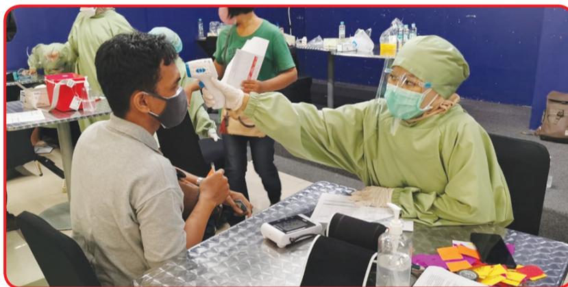
Tahap screening oleh tenaga medis agar vaksin dapat diterima tubuh dengan optimal.

TANGERANG SELATAN (IM) - Dinas Kesehatan Kota Tangerang Selatan dan Dinas Kesehatan Kabupaten Tangerang kembali menggandeng Sinar Mas Land untuk menggelar sentra vaksin di BSD City. Hal ini mendukung upaya pemerintah dalam percepatan program vaksinasi Covid-19.