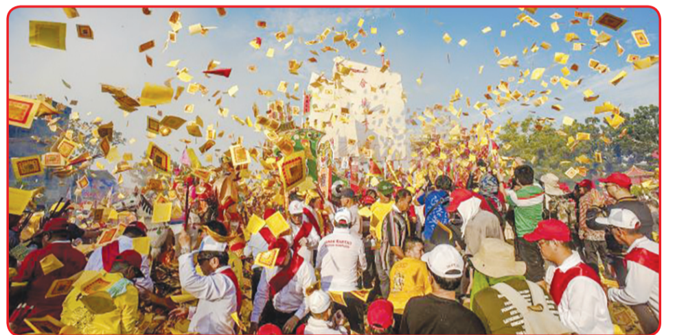
Momen ritual bakar tongkang atau yang dikenal dengan Go Gek Cap Lak di Bagansiapiapi, Riau.

karena pandemi, kami mohon maaf event ini tidak bisa dilaksanakan," tandasnya. Sementara itu, salah satu tokoh masyarakat Tionghoa setempat Chandra menyampaikan ucapan terimakasih atas kunjungan dan dukungan yang diberikan Bupati Rohil Afrizal Sintong. Dia juga berharap wabah Covid-19 ini segera berlalu. Sehingga, di tahun mendatang mereka bisa merayakan event bakar tongkang seperti dua tahun sebelumnya. Chandra menambahkan kegiatan di kelenteng In Hok King saat ini hanya sebatas sembahyang dan tetap menerapkan protokol kesehatan. • idn/din