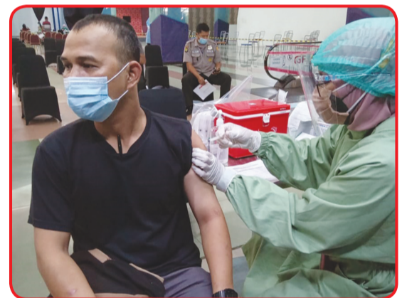
Salah seorang peserta di sentra vaksin di BSD Junction.