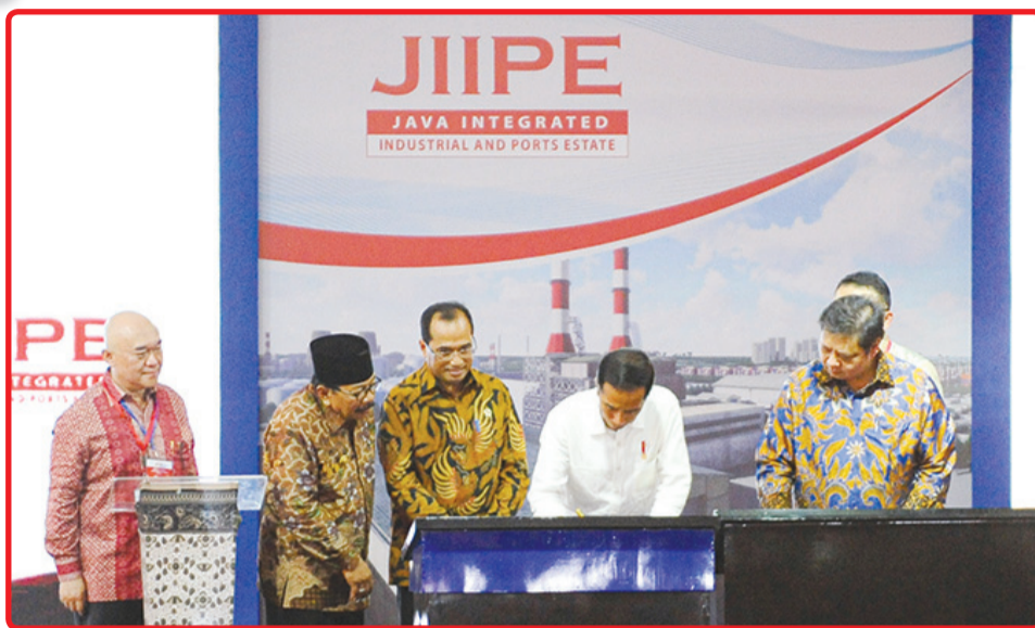
Peresmian JIPE bersama Presiden Joko Widodo tahun 2018.