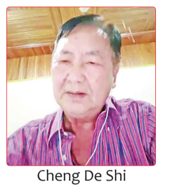
Cheng De Shi

Lomba berlangsung online dan offline. Lomba penulisan esai online diselenggarakan melalui platform Zoom meeting. Diikuti siswa tingkat dasar, menengah dan atas. Tema tingkat dasar yaitu "Wo de ..." dan "Yici nanwang de ...". Sedangkan tema tingkat menengah yaitu "Jiaru Zai You Yici Jihui, "Gei Fumu de Yifeng