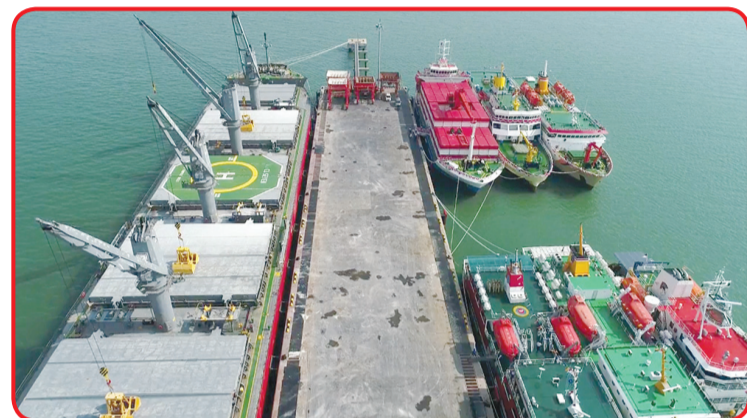
Pelabuhan Kawasan Ekonomi Khusus Gresik JIPE.

Fasilitas ini menjawab kebutuhan industri dalam menghasilkan efisiensi, juga