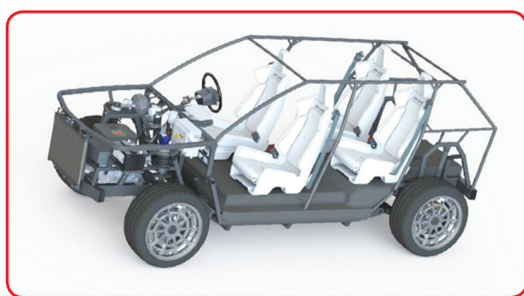
Desain sasis atau kerangka i-Deora.