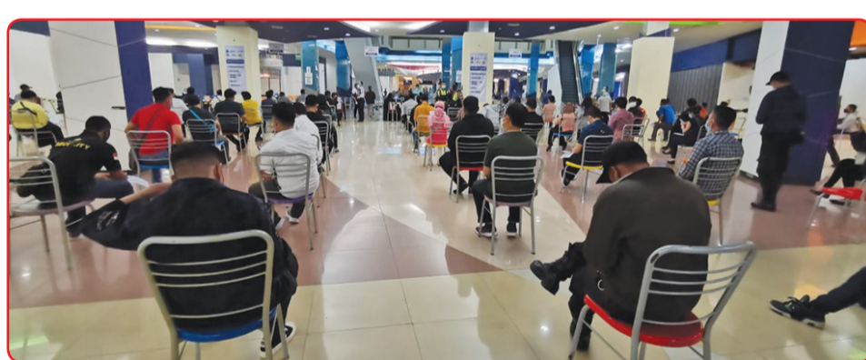
Antrean peserta vaksin berlangsung tertib.

Di hari yang sama, Sinar Mas Land juga berpartisipasi dalam mobilisasi para peda-