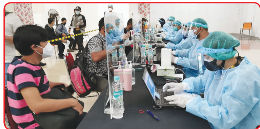
Tim medis Dinas Kesehatan Kota Tangerang Selatan dan Dinas Kesehatan Kabupaten Tangerang melayani peserta vaksin.