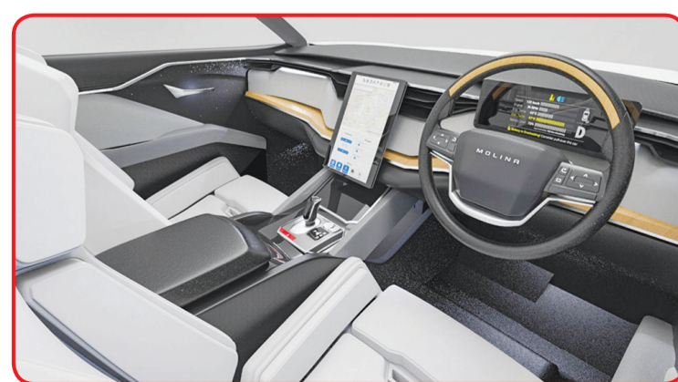
Desain interior sisi depan i-Deora.