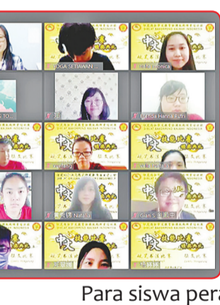
Para siswa peraih penghargaan.

bersama-sama meningkatkan ketrampilan agar lebih kuat. Terakhir, Guru Xiao Yi Mei berdoa semua pihak dapat bekerja dengan lancar. Diberikan kesehatan, kesuksesan bidang akademis, serta sukses seperti yang diharapkan. Semua guru yang hadir mengucapkan selamat kepada para peraih penghargaan. Setiap bulan April, Kelas Pelatihan Tenaga Pengajar BKPBM Kalbar selalu menyelenggarakan kompetisi ketrampilan bahasa Tionghoa. Program lomba