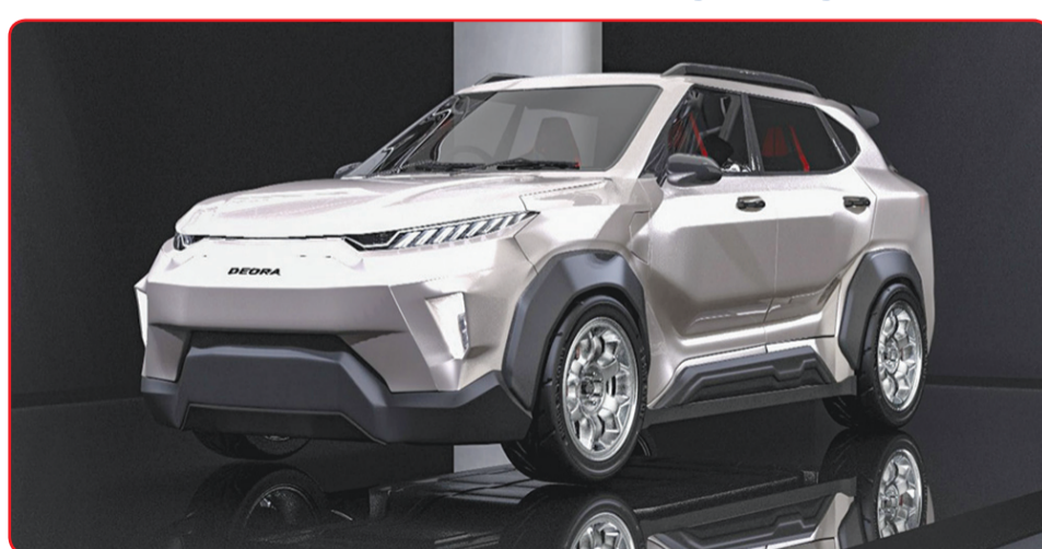
Para anggota tim Sach - Molina ITS, perancang mobil listrik i-Deora

“Sebagai mobil listrik, i-Deora dicanangkan sebagai solusi Indonesia di tahun 2030 atas permasalahan lingkungan. Kendaraan ini tanpa polusi, aman dan sangat nyaman un-