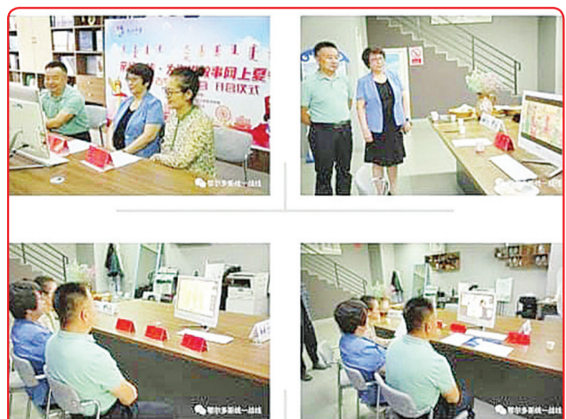
Kegiatan pembelajaran perkemahan musim panas Kota Ordos Mongolia Dalam.